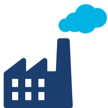
Ô nhiễm không khí

Nhiều thứ chúng ta làm ở nơi làm việc có thể gây ô nhiễm và tạo ra rác thải. Các mối hiểm họa phổ biến trong bán lẻ bao gồm: