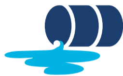
Sự cố tràn hóa chất